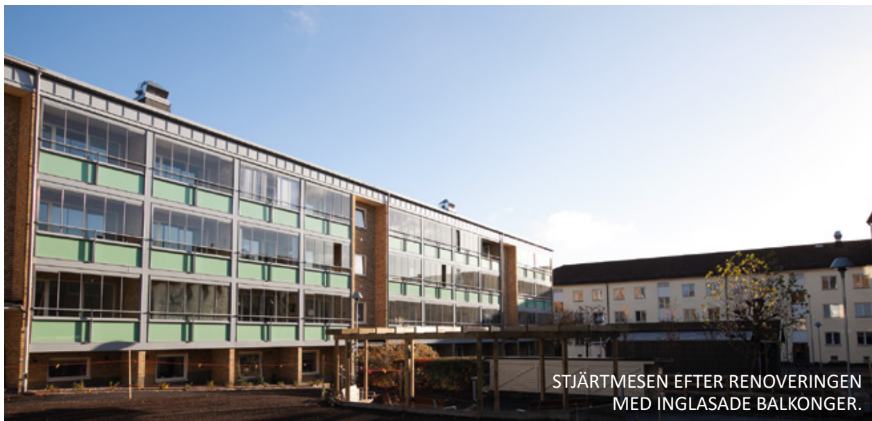
STJÄRTMESEN EFTER RENOVERINGEN MED INGLASADE BALKONGER.