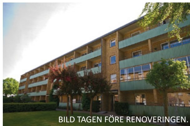
BILD TAGEN FÖRE RENOVERINGEN.

Nu ska lugnet få lägga sig, och efter ett så omfattande ombyggnadsprojekt är vi glada över att vi nu äntligen kan beskåda resultatet. På bilderna kan ni se hur det ser ut före och efter renoveringen!