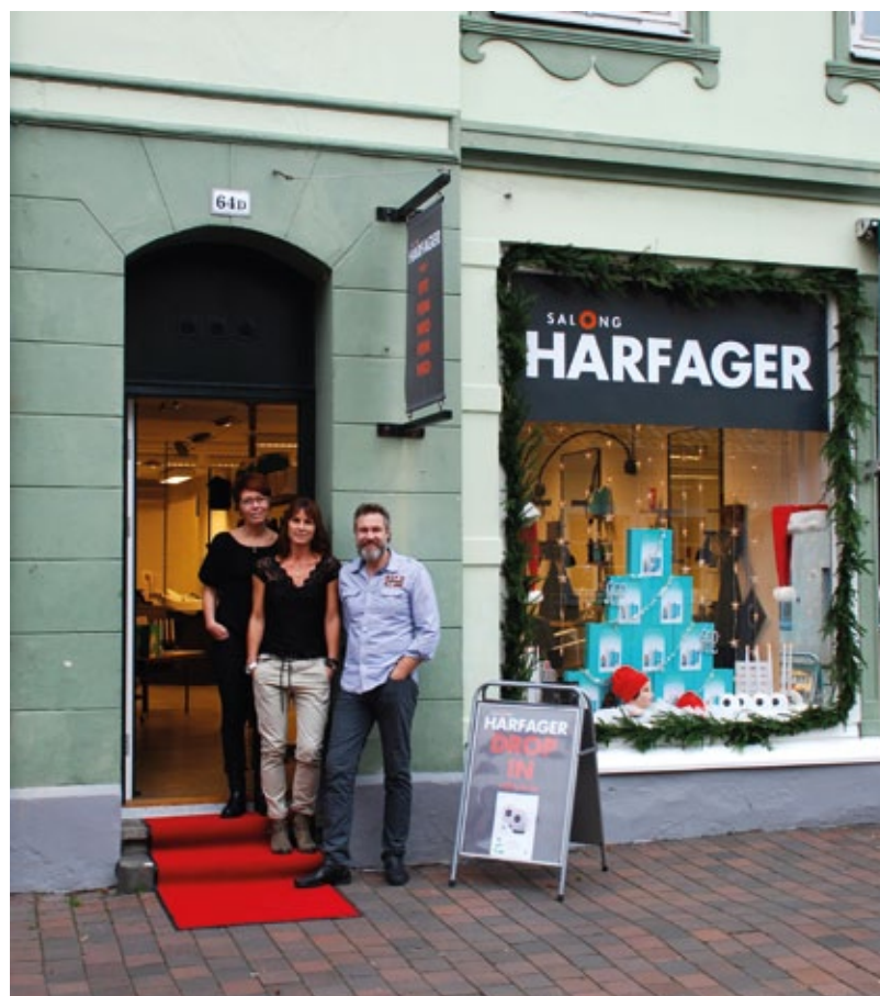
Här på Storgatan 64 ligger Salong Hårfager.

Ammoniakdoften är ett minne blott och alla produkter som säljs på Hårfager är paraben- och sulfatfria.