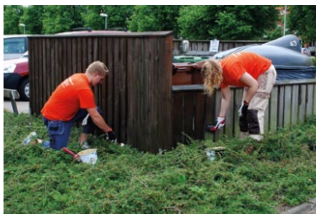
Sommarjobbare i full gång med att olja plank.