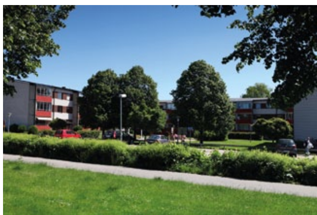
Mars sett från Margretetorpssvägen.

Under sommaren har Samhall gjort ett jättelyft med gården och beskurit buskar och snyggt till. Dessutom har våra sommarjobbare oljat plank. Vi hoppas att ni som bor här ska känna er riktigt välkomna till oss på Melin Förvaltning!