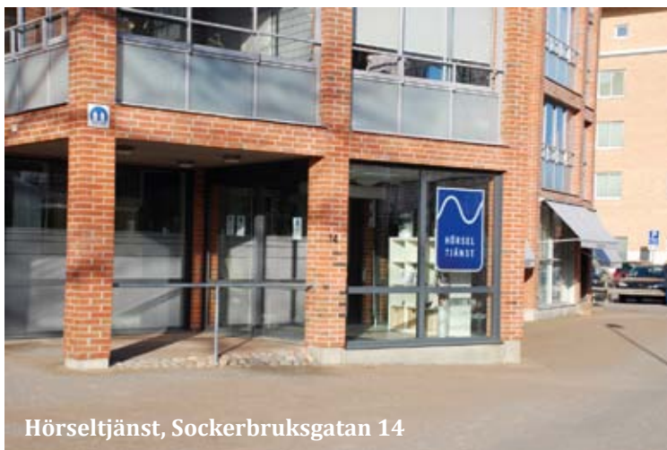
Hörseltjänst, Sockerbruksgatan 14

Under det sista året har vi genomfört några större lokalombyggnader för att möta verksamheternas ändrade behov. Till dessa hör Nybrohuset, Läkarhuset Roslunda och Hörseltjänst. Vi är stolta över att ha fått verksamheternas förtroende att utveckla samarbetet!