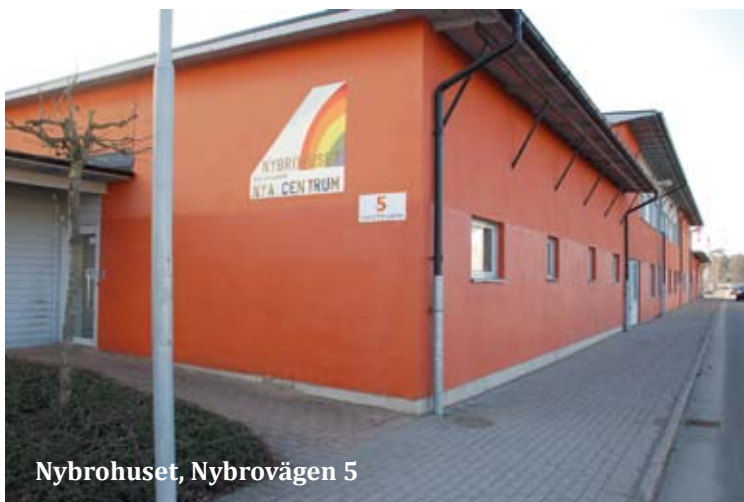
Nybrohuset, Nybrovägen 5

NYBROHUSET ligger på Nybrovägen 5 vid Bowlinghallen. Hela byggnaden har sedan länge hyrts av kommunen och här har funnits generösa lokaler för hemtjänst och handikappomsorg. I och med ombyggnaden har ytorna rationaliserats och gjorts mer ändamålsenliga. Både hemtjänst och handikappomsorg finns kvar, och ytterligare ett hemtjänstområde har fått utrymme här. Ombyggnaden gjordes under tidspress och hyresgästerna var till viss del kvar i lokalerna, vilket gjorde projektet krävande. Men, slutet gott - allting gott!