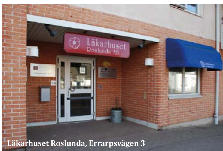
Läkarhuset Roslunda, Errarpsvägen 3

ROSLUNDA har sedan länge hyrt lokaler av oss på Errarpsvägen 3. I takt med att verksamheten har växt har också behovet av yta ökat. Efter en tids funderande öppnades möjligheten att bygga om två lägenheter på planet ovanför vårdcentralen. Här har man nu samlat all administration som inte behöver vara nära patienterna, och på så sätt skapat mer plats i själva vårdcentralens lokalen. Här finns både kontorsrum samt ett stort lunchrum och kombinerat mötesrum där alla anställda får plats.